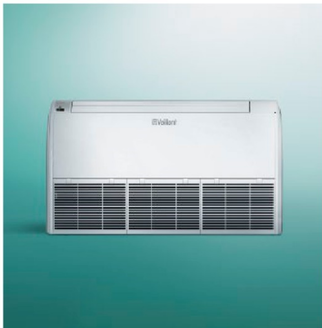
climaVAIR vrijstaand vloer- of wandmodel